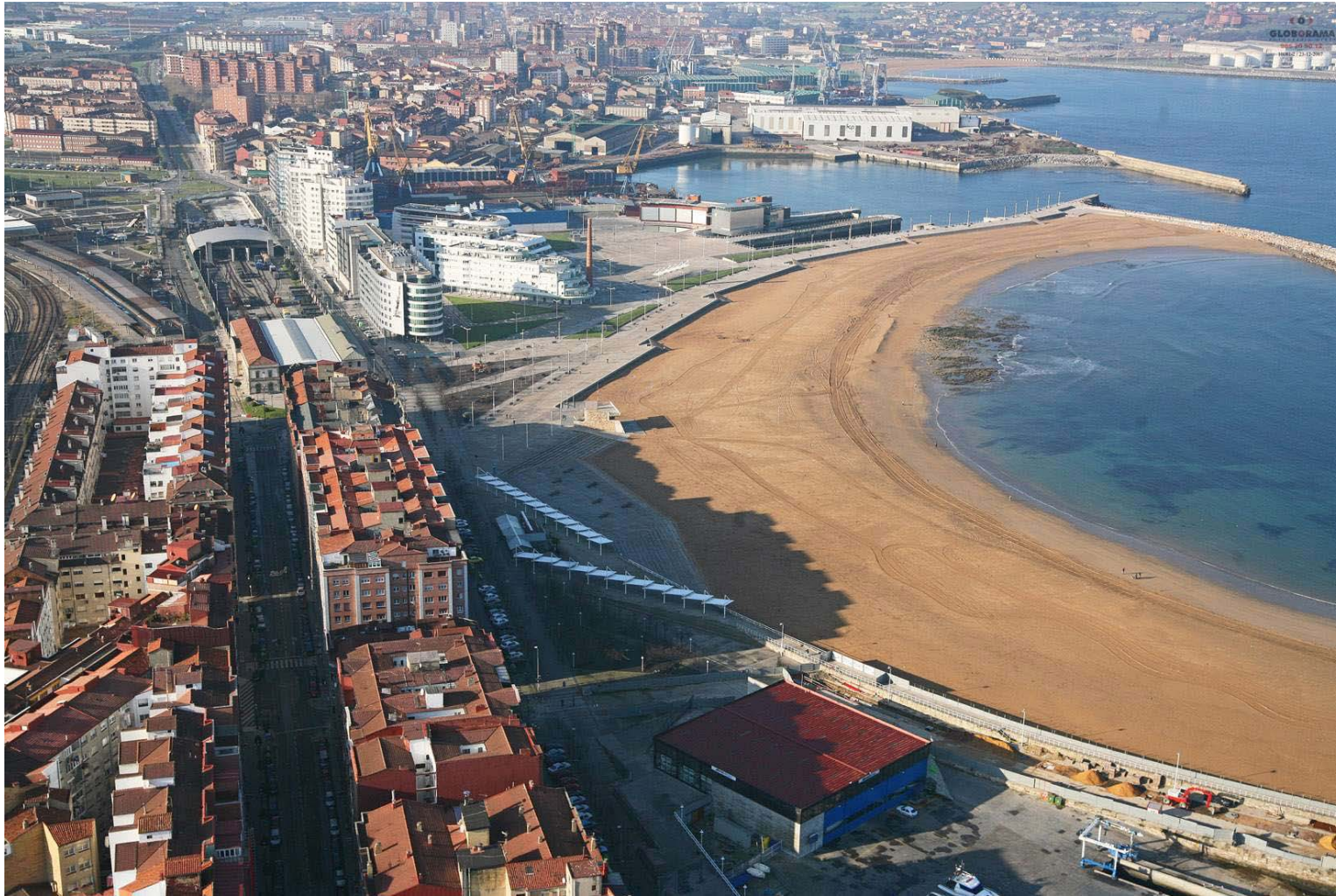
SOMBRAS EXISTENTES SOBRE LA PLAYA 23 DE DICIEMBRE / 11:30 h.