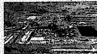
Proyecto minero de Roy Hill, en Australia, ya ejecutado y en reclamación.

► Rentabilidad. Duro revisa los protocolos internos de actuación y los criterios estratégicos. Su modelo de negocio priorizará sobremanera los