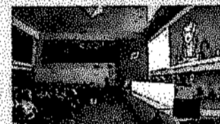
Junta general de accionistas de Duro el año pasado, en Oviedo.

► Reclamaciones. El grupo formalizará esta semana la petición de arbitraje en Singapur por el impago de Samsung en el proyecto de Roy Hill, de Australia, ya finalizado. En las próximas semanas hará lo mismo con la central de ciclo combinado de Vuelta de Obligado, en Argentina.